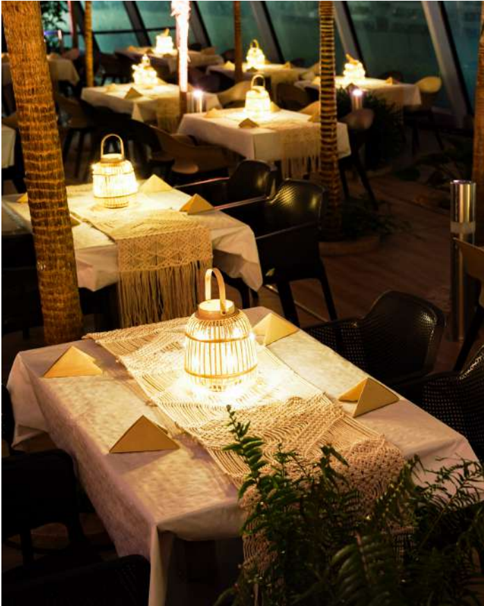
Kolacja po palmami (zdjęcie z realizacji)